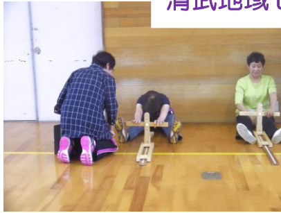
清武地域センター会場

また、生活習慣病や転倒防止についての講義、ニュースポーツや健康体操などこれからの健康づくりに役立つメニューがたくさん含まれています。