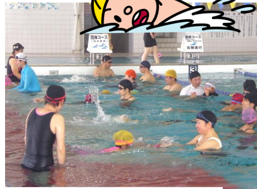
黒瀬屋内プール（親子水泳教室）

★安芸津 B&G 海洋センタープール・黒瀬屋内プールとも温水プールですので年中ご利用ができます。（ただし毎週月曜日・年末年始は休館）