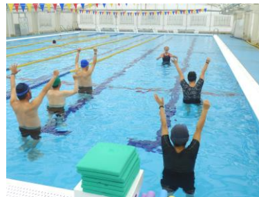
水中エクササイズ教室