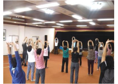
健康増進運動教室

水辺の安全推進事業として、黒瀬B&G艇庫では、夏期に『B&G黒瀬安芸津海洋クラブ』の活動を計15回行い、海洋性スポーツにチャレンジしました。また、この海洋クラブの参加者が2年連続で県大会・中国大会に出場し、見事、優勝する快挙を達成しました。30年度の大会も楽しみです。