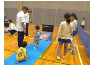
アクアパークチャレンジスポーツ

アクアパークでは、体育の日の恒例行事『アクアパークチャレンジスポーツ』を13種目の競技団体の協力のもと開催し、子供たちが様々なスポーツに挑戦し、心地よい汗を流しました。5月からスタートした『東広島市生きがい健康体育大学』（計11回教程）は、11月に終了し、第18期生が無事卒業をされました。その他各種スポーツ教室（前後期、計10教室）は、現在後期開催中です。平成30年もたくさんの方に参加して頂き、健康・体力・仲間づくりに励んでいただければと思っています。