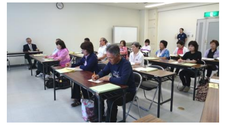
生きがい健康体育大学