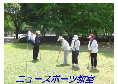
ニュースポーツ教室

安芸津B&G海洋センタープールと黒瀬屋内プールでは、『プールでカヌー体験会』を行い、プールでのカヌー体験以外にもライフジャケット着衣泳や浮き身体験などをして水辺の安全について学びました。