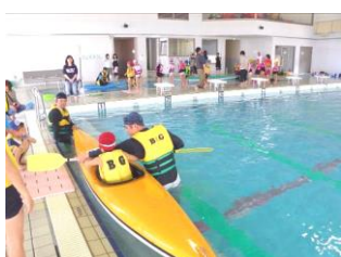
プールでカヌー体験会