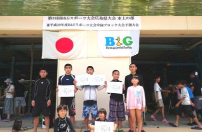
B&G黒瀬安芸津海洋クラブ

また、小学生とその保護者対象の『親子水泳教室』、初心者（一般）対象の『リフレッシュ水泳教室』、音楽に合わせて水中運動をする『アクアビクス教室』などを開催しました。プールでは泳ぎだけでなく、水中ウォーキングで健康づくりをされる方、家族で泳ぎを楽しまれる方と目的に合わせて教室に参加されました。