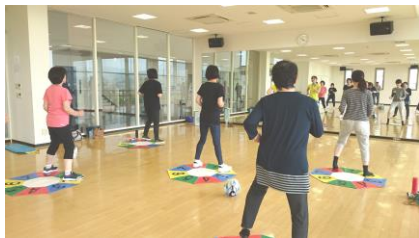
スリムアップ健康体操教室

また、29年度から新たに『スリムアップ健康体操教室』（黒瀬屋内プール）・『水中エクササイズ教室』・『きつず運動教室』（安芸津B&G海洋センター）が始まりました。